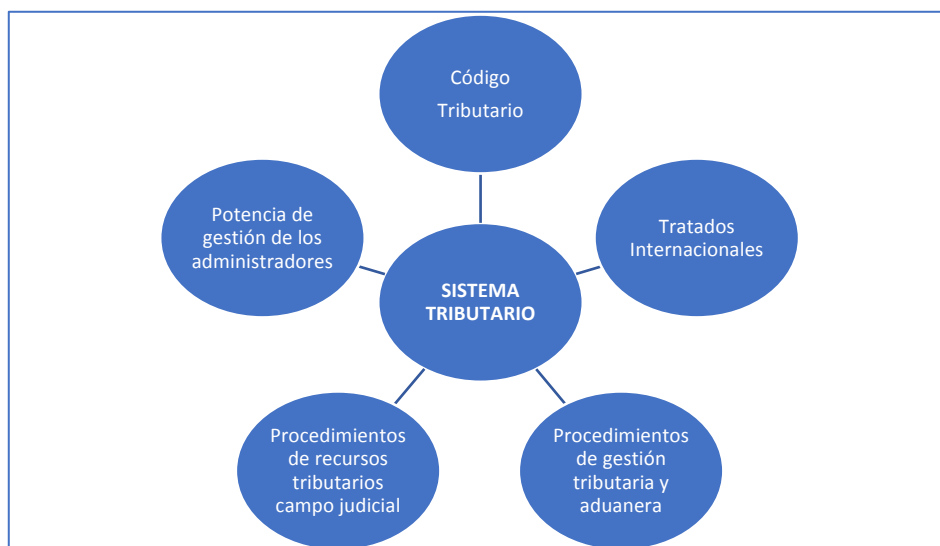
Figura 1 Elementos del Sistema Tributario