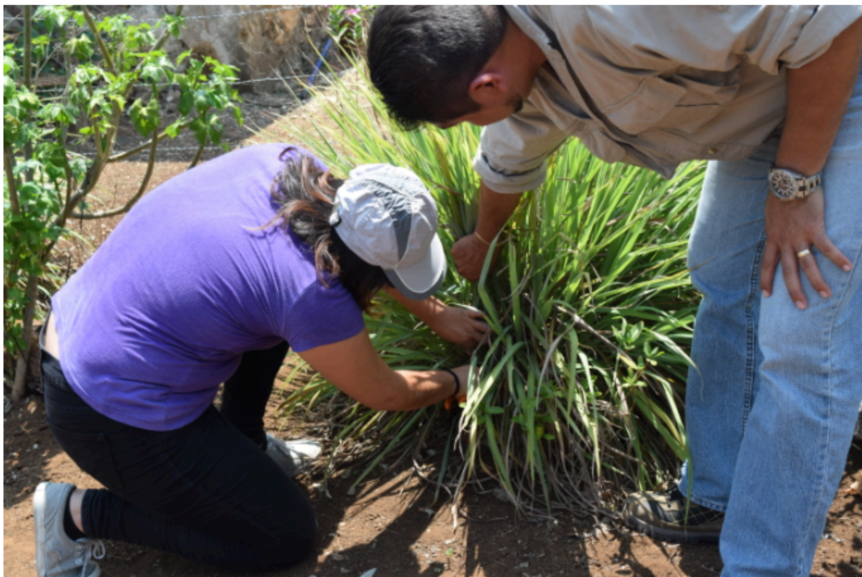
Figura 2 Trabajo de campo, 2017

La diversidad de estilos de aprendizaje y canales de percepción que existe en el grupo de estudiantes en análisis, sugiere que las estrategias de enseñanza y aprendizaje aplicadas por los facilitadores deben ser variadas y en cierta medida equilibradas a fin de evitar centrarse en un solo enfoque (Gamboa, Briseño y Camacho, 2015).