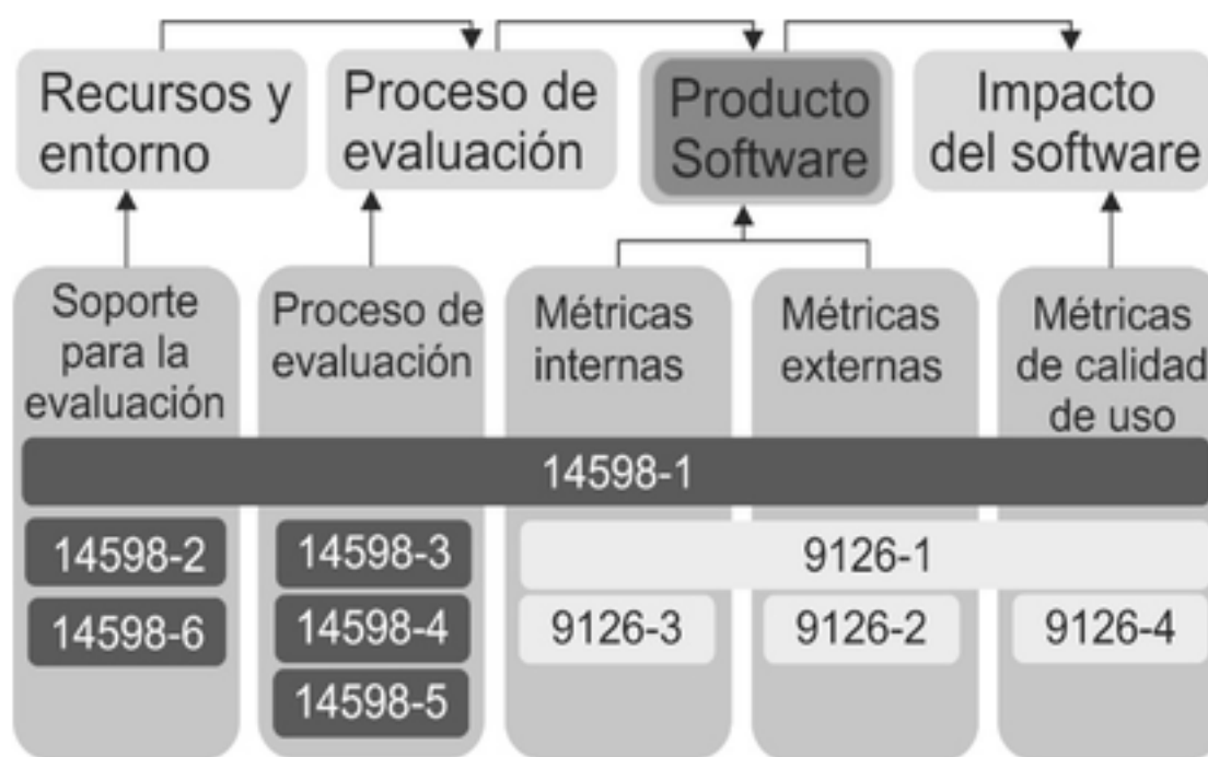
Figura 1 Relación entre las normas ISO/IEC 9126 e ISO/IEC 14598.

Como modelo de calidad el LIPS adoptó las recomendaciones de la parte 1 de la norma ISO/IEC 9126 (ISO-IEC, 2005), pues garantiza la satisfacción de requisitos de un sistema de gestión de la calidad durante el desarrollo, evaluación y certificación del software, estableciendo también que con la acreditación se alcanza la demostración de la competencia técnica (Capote y otros, 2014). Sin embargo, dado que la ISO/IEC 9126 especifica un modelo de calidad general, en el LIPS se decidió aplicar complementariamente la NC-ISO/IEC 14598 (ISO/IEC, 2001) para establecer los procesos a realizar durante la evaluación de la calidad del producto software. La relación entre las normas ISO/IEC 9126 e ISO/IEC 14598 se esquematiza en la Figura 1. No obstante, los autores reconocen que idealmente debe emplearse la norma ISO/IEC 25000 (ISO/IEC, 2013) conocida como SQuaRE (requerimientos y evaluación de la calidad de productos de software, por sus siglas en inglés), pero no la aplicaron pues para la fecha no estaba aún homologada en su país (Brito, Góngora y Capote, 2014).